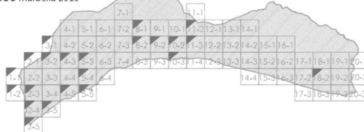
PGOU Marbella 2010

El PGOU aprobado provisionalmente por el Pleno del Ayuntamiento de Marbella el 29 de julio de 2009, convocado de urgencia, para su remisión a la Junta de Andalucía, fue la versión presentada por el Equipo Redactor el 12 de junio de 2009 , como evidencia la página 93 del Acta del Pleno, y no podía ser de otra manera, pues esa versión, la fechada el 12 de junio de 2009 era la única que habían visto los señores concejales, y por tanto es la única sobre la cual podían emitir su voto. Nadie puede votar acerca de algo que no ha visto o cuya existencia desconoce, como es evidente.